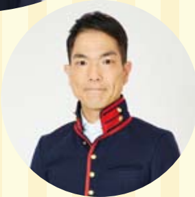
徳島県応援芸人 中山女子短期大学